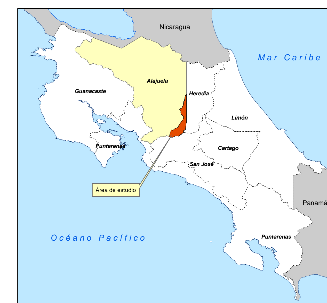
MATRIZ DE INFORMACIÓN DE VALORES DE TERRENOS POR ZONAS HOMOGÉNEAS PROVINCIA 2 ALAJUELA CANTÓN 01 ALAJUELA DISTRITO 09 RÍO SEGUNDO